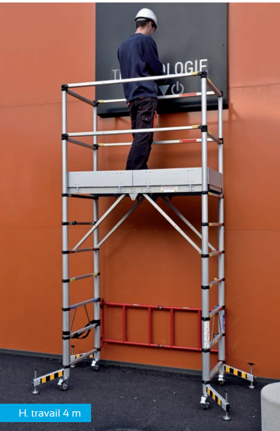
H. travail 4 m