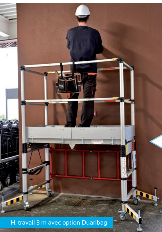
H. travail 3 m avec option Duaribag