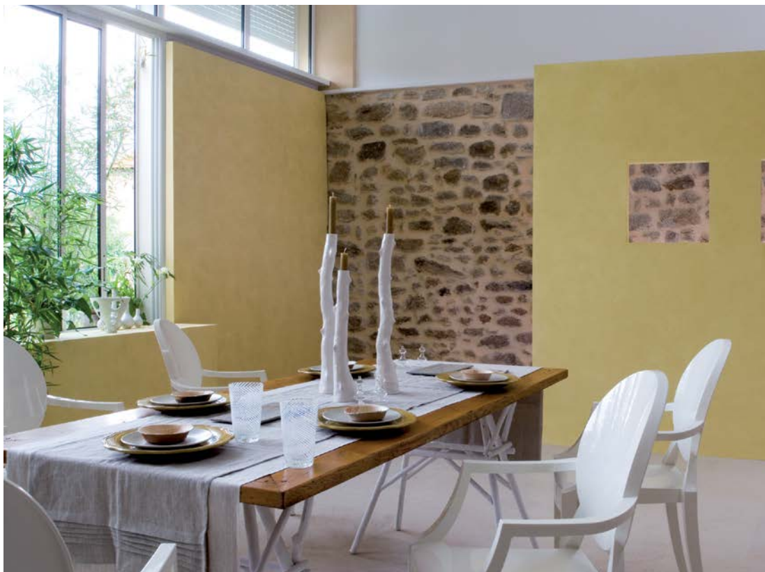
Teinte : Bosra