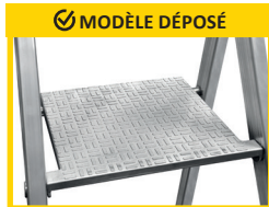
PLATE-FORME DE TRAVAIL ANTIDÉRAPANTE en fonte d'aluminium. Dimensions 250 X 250 mm.

Articulation haute résistance en fonte d'aluminium qui enveloppent le profil arrière.