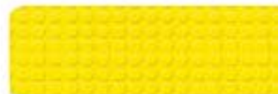
Jaune Réf 4302

Epaisseur totale 3,5mm. Couche d'usure 1,2mm. Peuvent se souder à froid et à chaud. Bords arrondis.