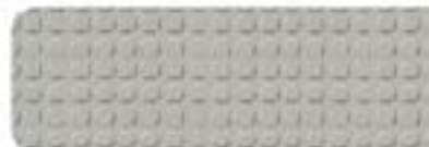
Gris clair Réf 4301