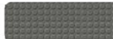
Gris foncé Réf 4300