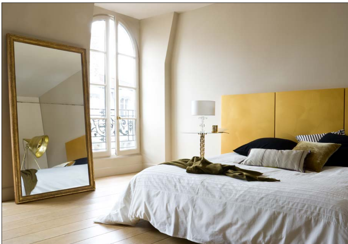
Tête de lit : Jaïpur Bombay - Murs : Mat 78 Hydroplus 90-909 - Plafonds : Covryl Mat