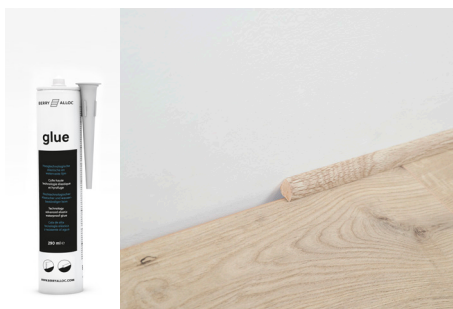
installation avec BerryAlloc Glue