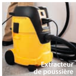
Extracteur de poussière