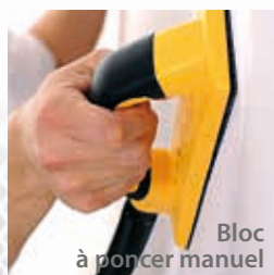
Bloc à poncer manuel