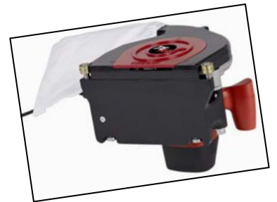
Montée sur 4 roulettes

Diamant forme elliptique pour cordons 4 mm de Ø.