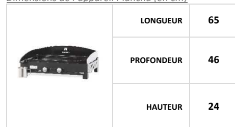
Dimensions de l'appareil Plancha (en cm)