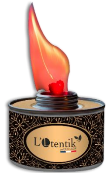
Dimension torche Ø 85 mm

Sortir la torche de son étui et le sachet de la rondelle. Dévisser le bouchon et redresser la mèche. Ouvrir le sachet et placer la rondelle autour de la mèche. Allumer la mèche avec un briquet. La chaleur de la torche va diffuser la matière active de la rondelle pour une efficacité immédiate. Durée d'utilisation environ 5h30. Pour éteindre la torche en cours de combustion, utiliser le bouchon en métal afin d'étouffer la flamme. Attendre plusieurs minutes avant de remettre le bouchon. Se laver les mains après manipulation.