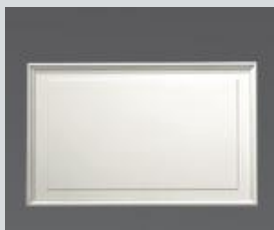
4071 / LAMBRIS