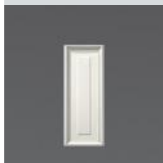
4072 / LAMBRIS