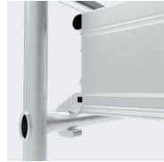
Crochets de plateau ergonomique, installation facile