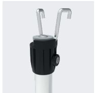
Perche T-Grip pour montage/démontage des lisses en sécurité