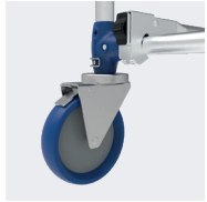
Roues Ø 200 mm réglables tous les 12,5 cm