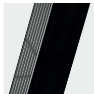
Montants en peinture époxy