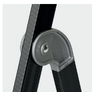
Articulations monobloc en fonderie d'aluminium, nervurées, ultra-résistante