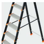
Sangles pour les modèles 7 et 8 marches