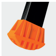
Sabots enveloppants antidérapants avec témoin d'usure