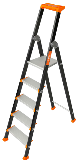
Modèle 5 marches

Avec ses marches de 110 mm, ses articulations en fonderie d'aluminium et ses montants renforcés, le KOLOS devient le marchepied le plus confortable du marché. Il répond à la norme EN 131, au décret 96333 et est labellisé NF.