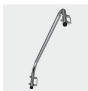
Rampe en option (ref : 02376450)