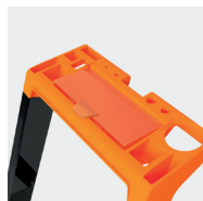
Porte-outils avec fermeture intégrée