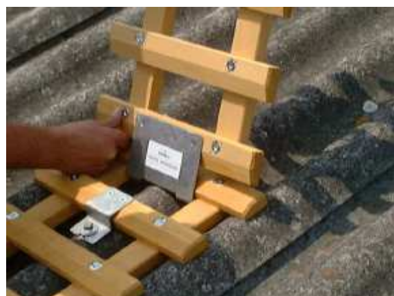
Système d'assemblage entre éléments

Référence du module de 2 mètres : B31200PA